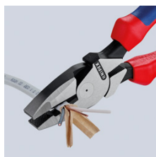
Продольное резание для разделения плоских кабелей