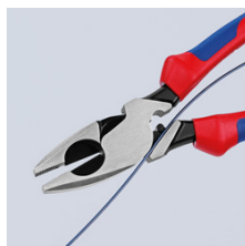
09 11/12 240: приспособление для втягивания кабеля в прорези шарнира